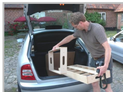
Några träfärdiga moduler efter en snickarträff

Mer information om moduler finns på hemsidan, www.nskalaskane.se .