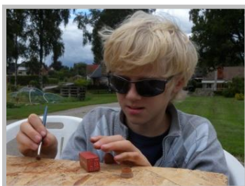
En container blir naturligt väderbiten.

SkånskaN ordnar också träffar med olika teman. Vad vi gör är upp till var och en att föreslå – är man nyfiken på något så kanske en träff kan ordnas runt det ämnet.