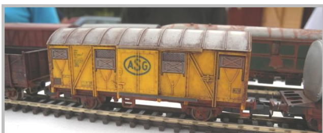
Nedsmutsad vagn på vädringskursen