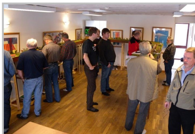
Intro till trafikspel på en liten modulbana