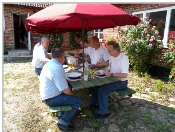
Matpaus för modulsnickarna