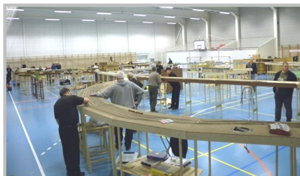
En modulbana i en handbollshall i Hellerup

Modulbyggarna träffas vid olika körmöten och bygger upp stora banor, unika för varje tillfälle. Dessa banor får ofta en längd på 100 meter eller mer.