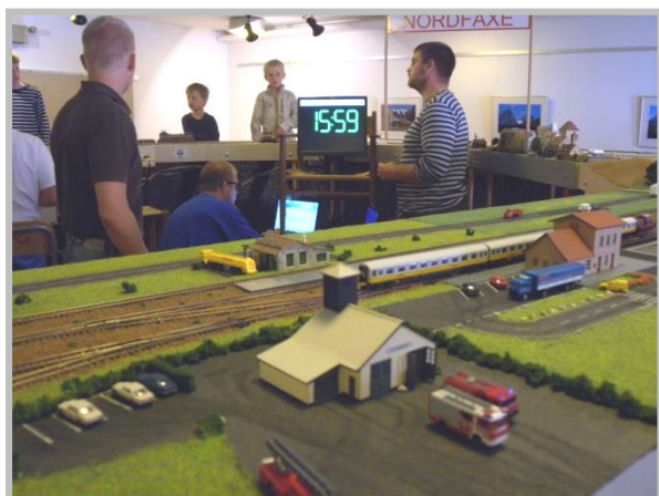
Vid trafikspel ges tiden av en snabbklocka

Modulerna används också då skånskaN är med på utställningar där vi bygger upp mindre utställningsbanor.