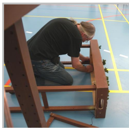
En modul under montering

Modulerna används också då skånskaN är med på utställningar där vi bygger upp mindre utställningsbanor.