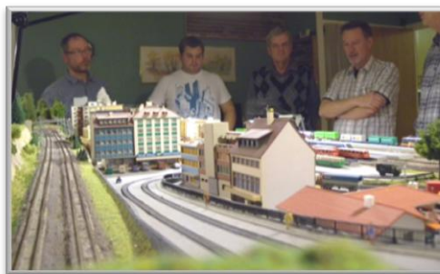
Studiebesök på hemmabana

Ett nyhetsbrev kommer ut med jämna mellanrum. Det innehåller allehanda information om vad som är på gång. Gamla nyhetsbrev finns på hemsidan.