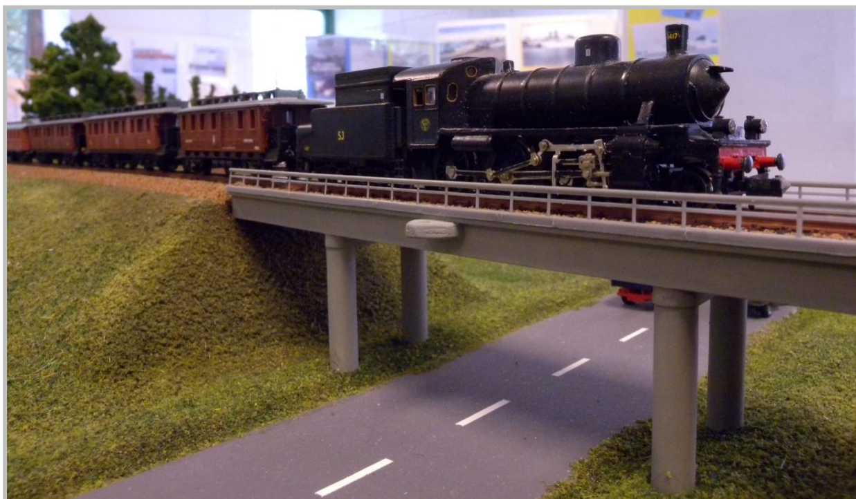
Ett svenskt B-lok ombyggt från Fleischmanns BR38